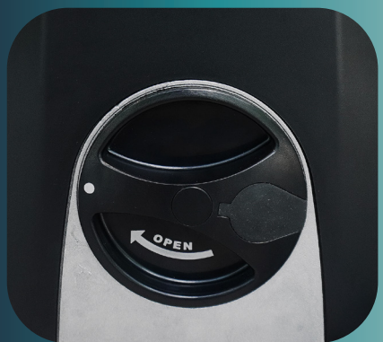
Déverrouillage par clé facile d'utilisation